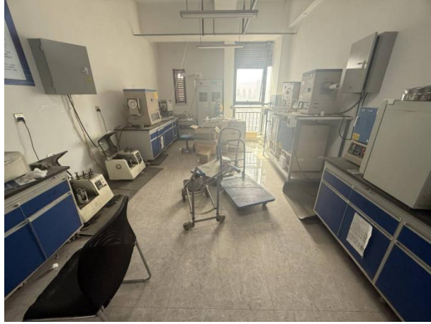
理工楼 1420: 卫生脏乱差