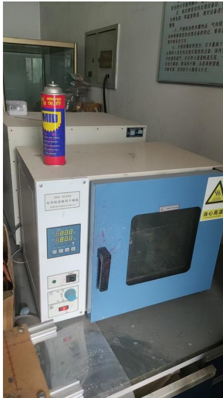
格致楼 2025：垃圾未及时清理，有自燃风险