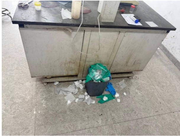
理工楼 1419: 卫生脏乱差