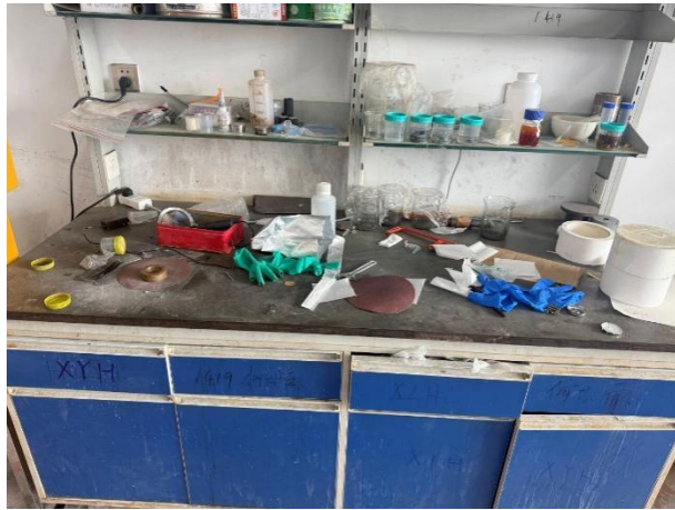
理工楼 1425: 卫生脏乱差